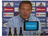
Neuanfang mit Breitenreiter: "Übergücklich und stolz"