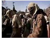
Al-Kaida-Vize im Jemen getötet