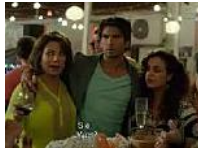
Ozean der Träume - Dil dhadakne do - Trailer