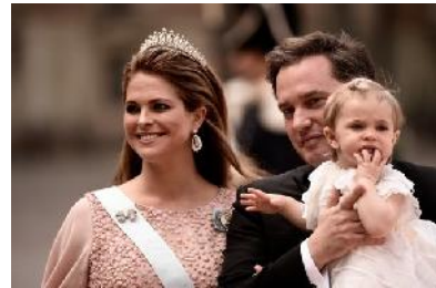
Prinzessin Madeleine von Schweden Das Baby ist auf der Welt