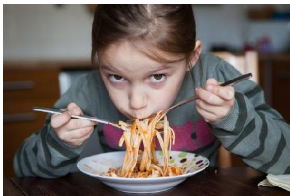
Ab wann sollten Kinder eigentlich Tischmanieren lernen?

Überall hängen die Spaghetti, die Soße klebt am Tischbein und das Kind ist total besudelt. Ab einem gewissen Zeitpunkt empfiehlt es sich, Kindern Tischmanieren beizubringen. Eltern können Vorbild sein. Und auch Spielchen helfen dabei.